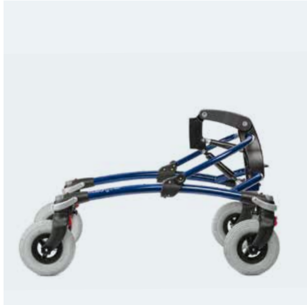
Misura 2, 3 e 4 con ruote grandi