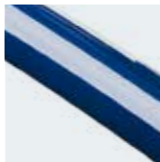
Misura 2 = Blu Oltremare