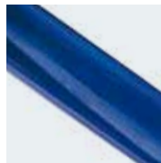
Misura 4 = Blu