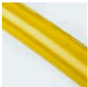
Misura 1 = Giallo